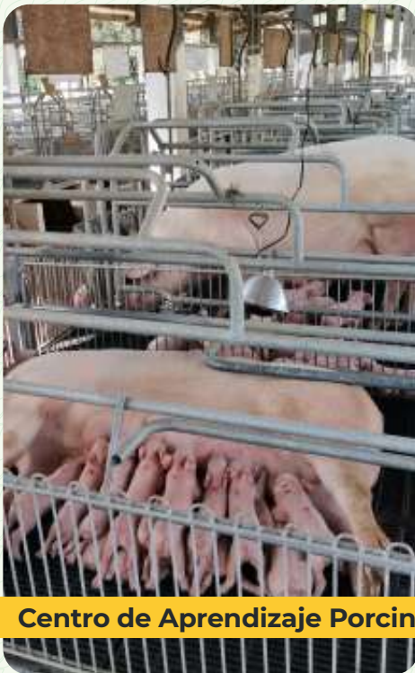
Centro de Aprendizaje Porcino

Gestión y administración pecuaria: Diseñada para establecer un conocimiento amplio e integrador sobre la gestión empresarial, con enfoque estratégico para el fortalecimiento de la cadena de valor de la producción pecuaria.