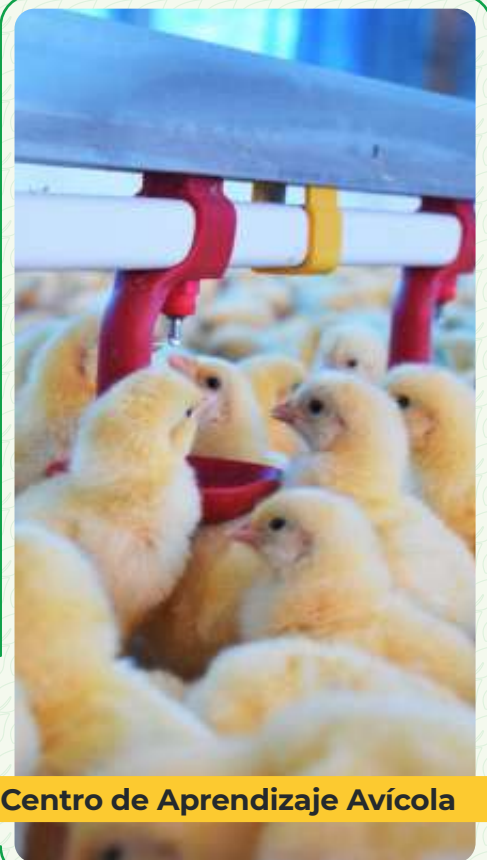
Centro de Aprendizaje Avícola

El programa cubre de manera integral el nuevo concepto de producción pecuaria sustentable, considerando aspectos biológicos, ecológicos, sociales y económicos, tomando como ejes transversales en el abordaje de la ganadería tropical: la Gestión Integral de Riesgos (GIR), el Cambio Climático (CC), la Investigación, la Vinculación, el Emprendimiento y Uso de las TIC, formando de este modo un profesional con una visión integral de la producción animal, adecuada a la realidad nacional con la capacidad de contribuir en la solución de la problemática del sector pecuario, proponiendo y gestionando sistemas de producción animal que sean soportables en lo ecológico, viables en lo económico y equitativos en lo social.