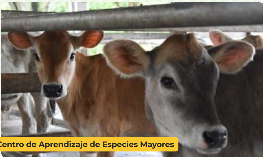
Centro de Aprendizaje de Especies Mayores